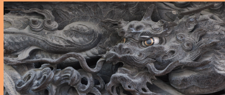
竹内八十吉彫刻（稲荷堂）