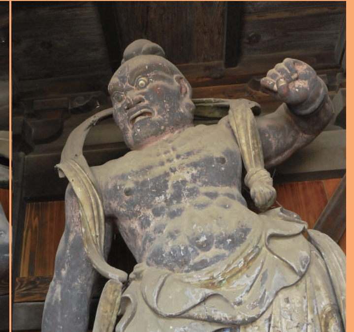
本陽寺仁王門（作者不明）